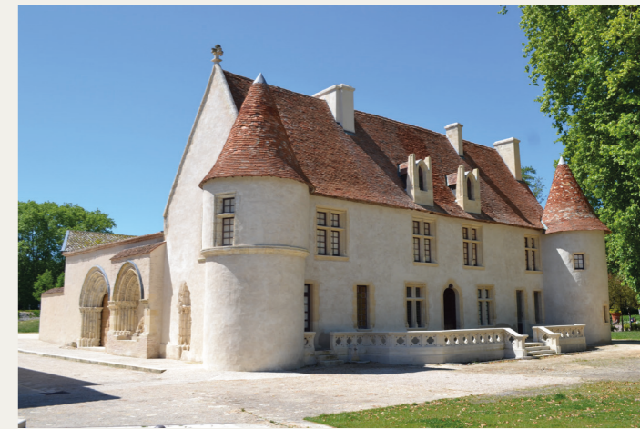
Prieuré de Cayac

A partir du XVI e siècle, les pèlerinages se font plus rares. Le déclin de Cayac est confirmé en 1731, l'église étant désaffectée. Après la Révolution Française, le prieuré de Cayac est vendu comme Bien National et perd ainsi sa vocation religieuse. A partir de 1806, différents propriétaires se succèdent. En 1979, la Municipalité rachète l'église puis le château-prieuré et ses dépendances en 1988. Elle redonne au site sa vocation d'accueil des pèlerins, en réhabilitant un gîte d'étape, géré par l'association des Amis de Saint-Jacques de Compostelle.